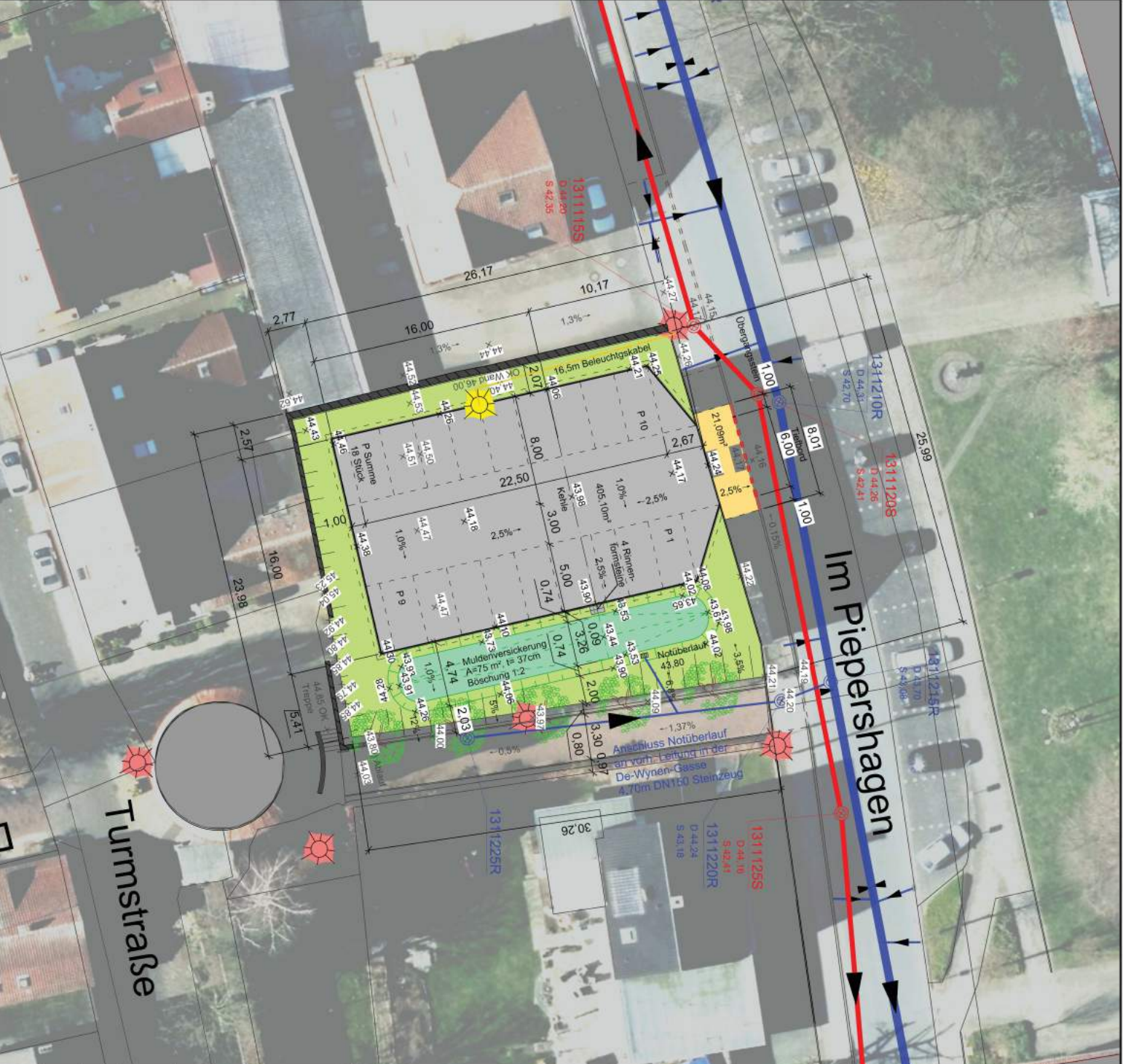
Detail Maßstab 1:40