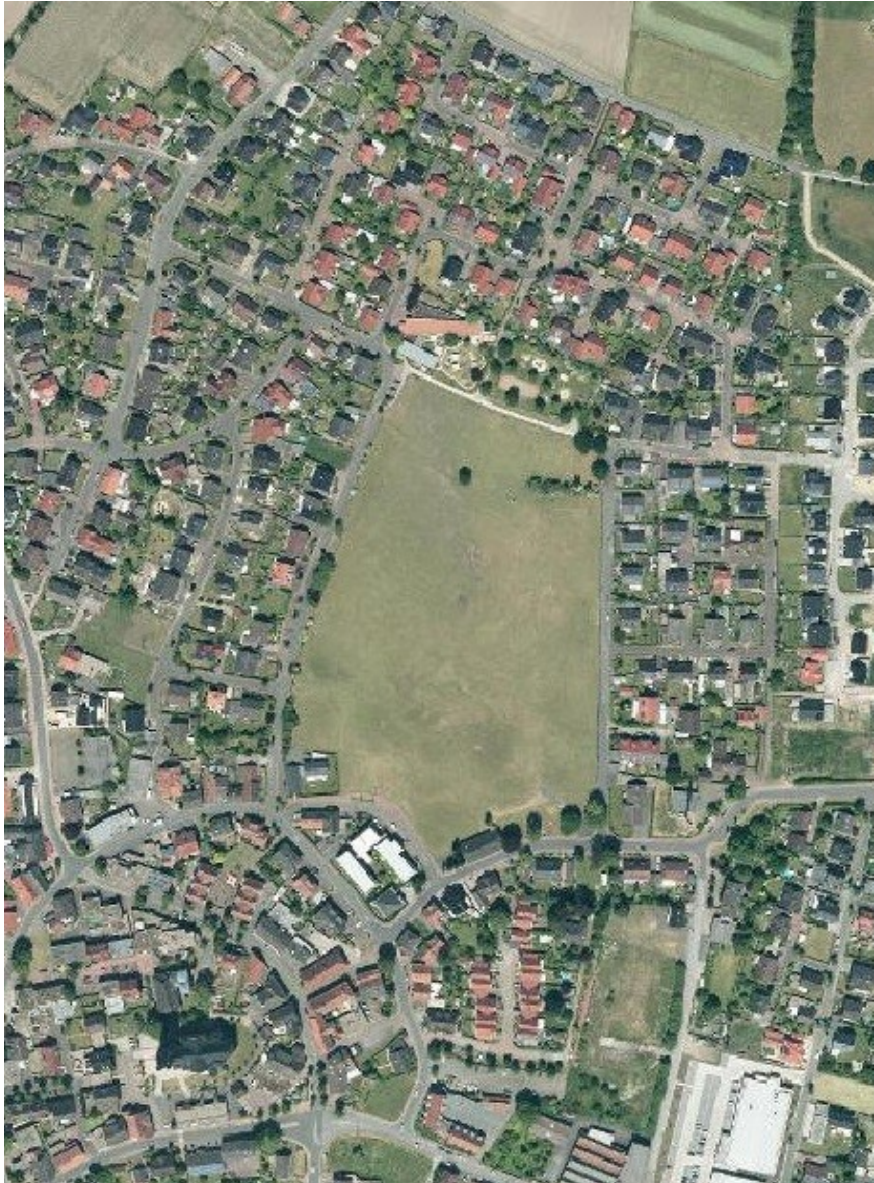
Luftbild 2015